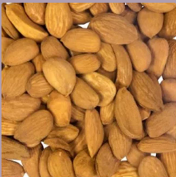
Mandorle Sangi(250 grammi)