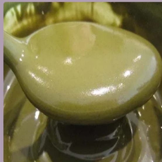
Crema di pistacchio(1000 grammi)