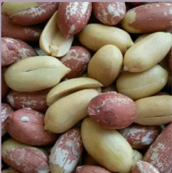
Arachidi Astaneh(250 grammi)