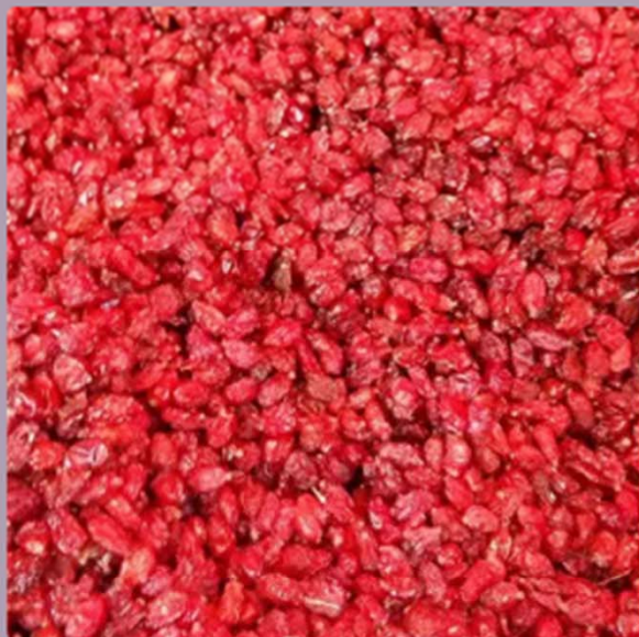
Crespino Pofaki(250 grammi)