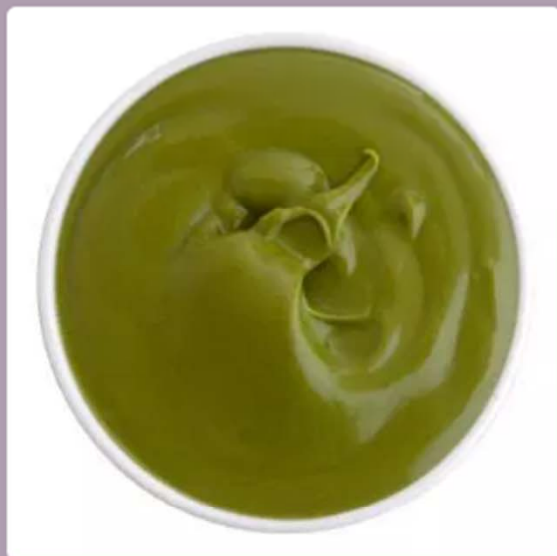
crema di pistacchio(100 grammi)