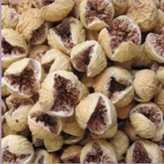
Fichi secchi premium(250 grammi)