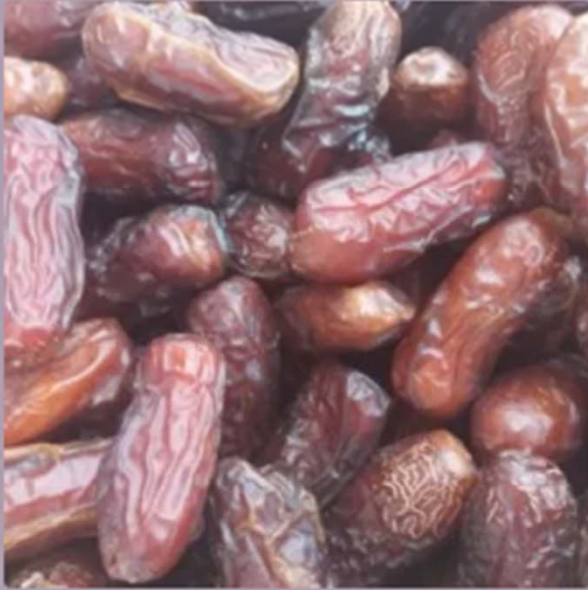
Dattero Piyarom(250 grammi)