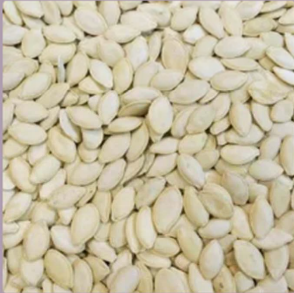
Semi di zucca(250 grammi)